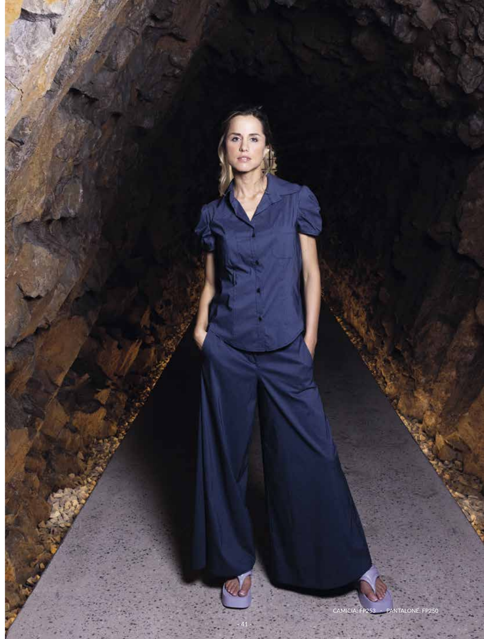
CAMICIA: FP253 - PANTALONE: FP250