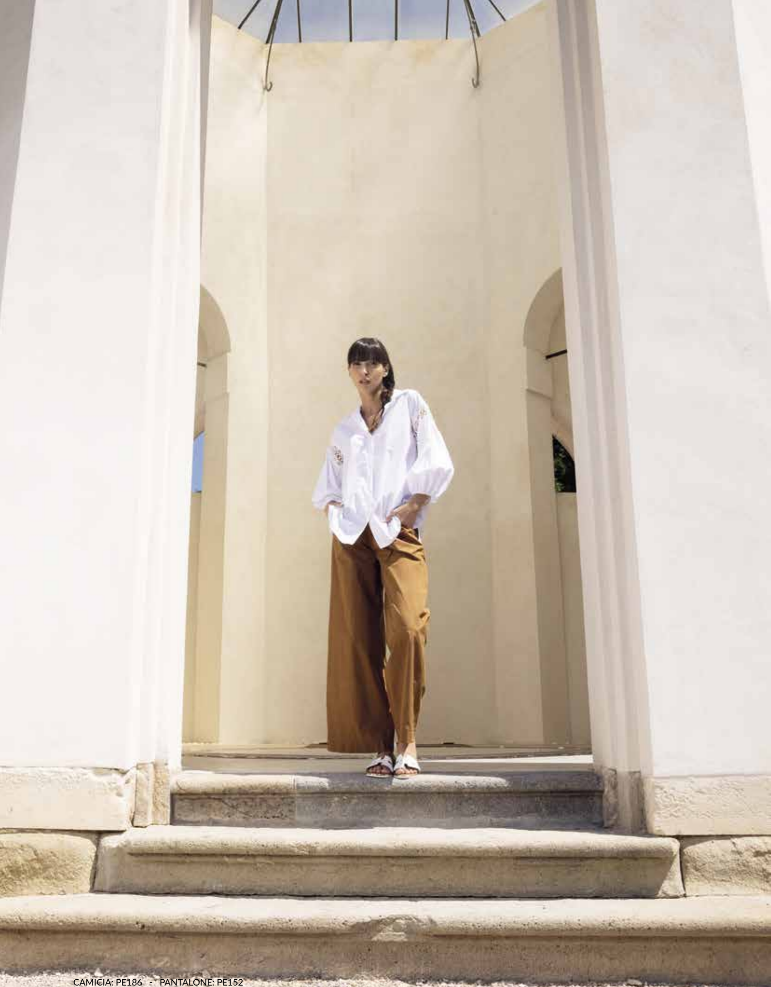
CAMICIA: PE186 - PANTALONE: PE152