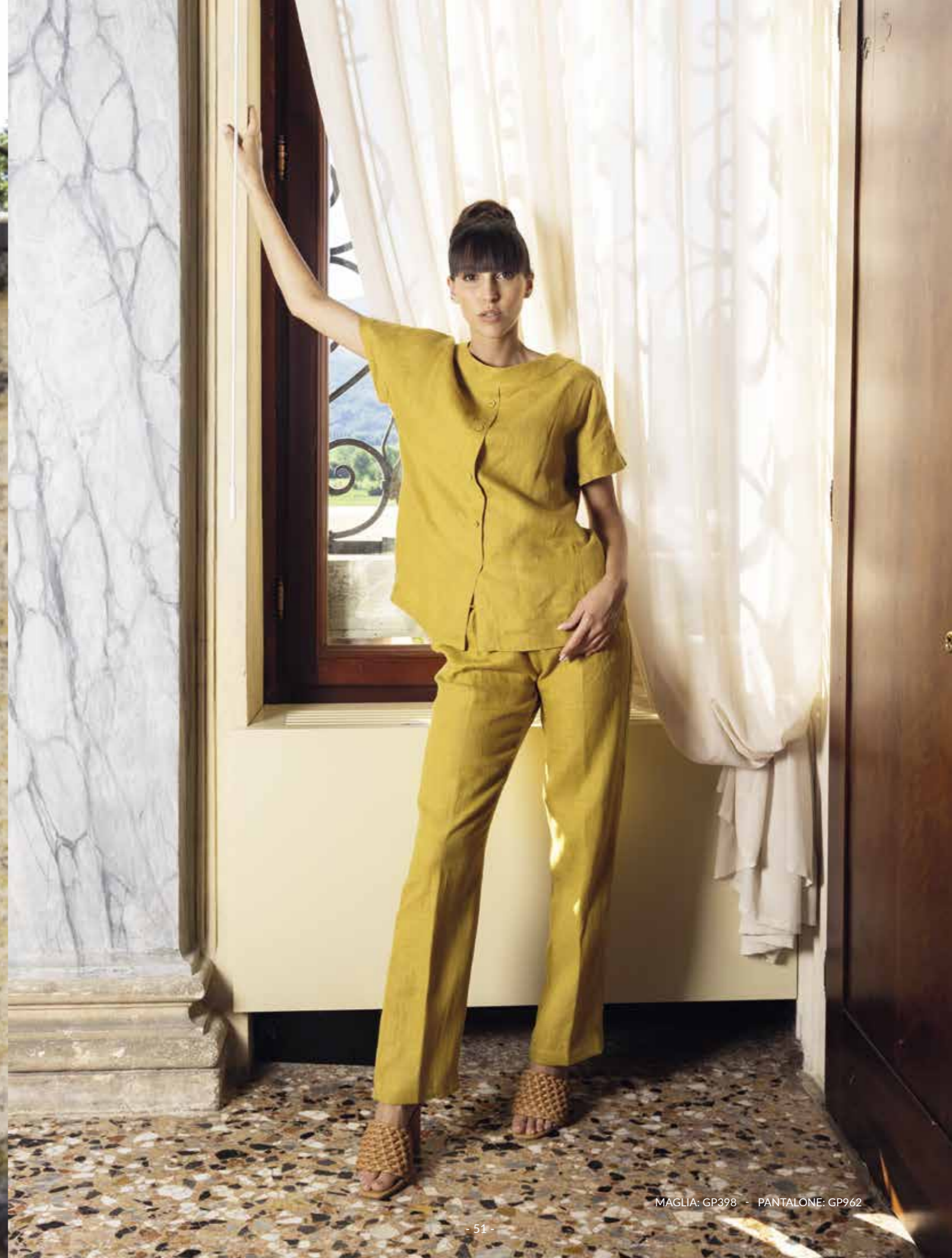
MAGLIA: GP398 - PANTALONE: GP962