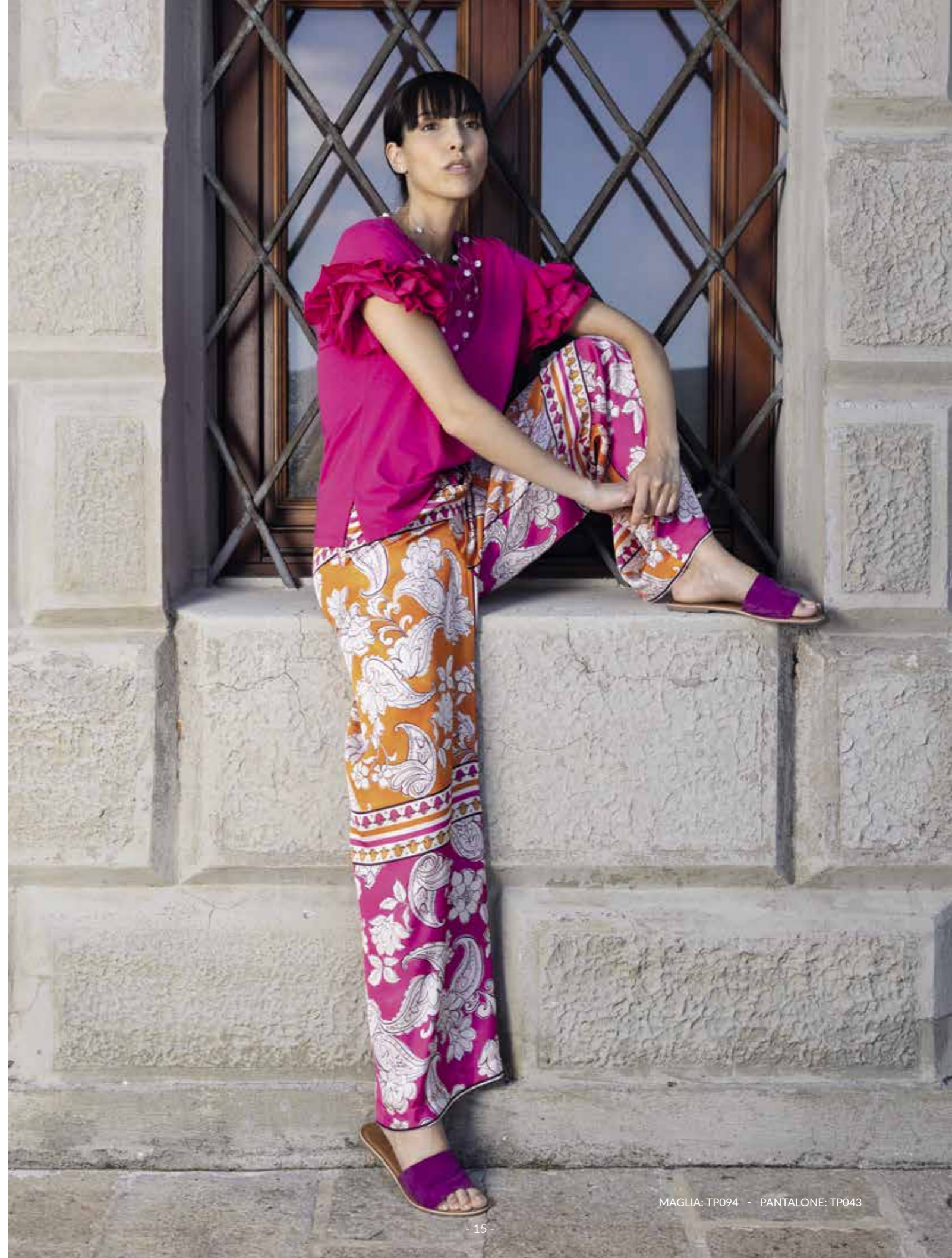
MAGLIA: TP094 - PANTALONE: TP043