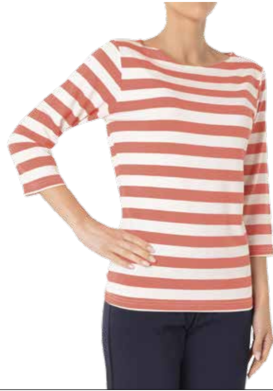
EP 806 (PREVISTO)