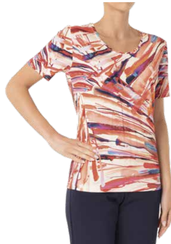
EP 819 (PREVISTO)