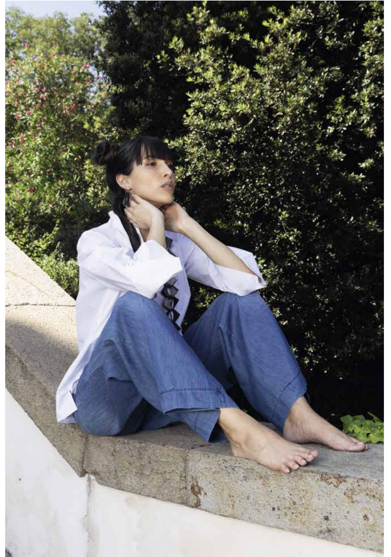
CAMICIA: PE157 - PANTALONE: PE181