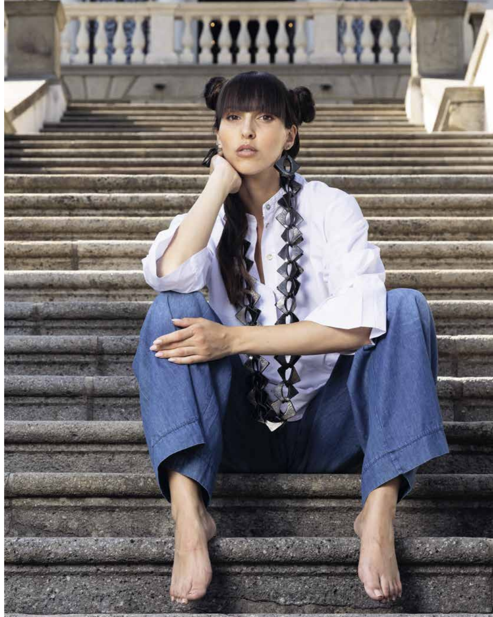
CAMICIA: PE157 - PANTALONE: PE181