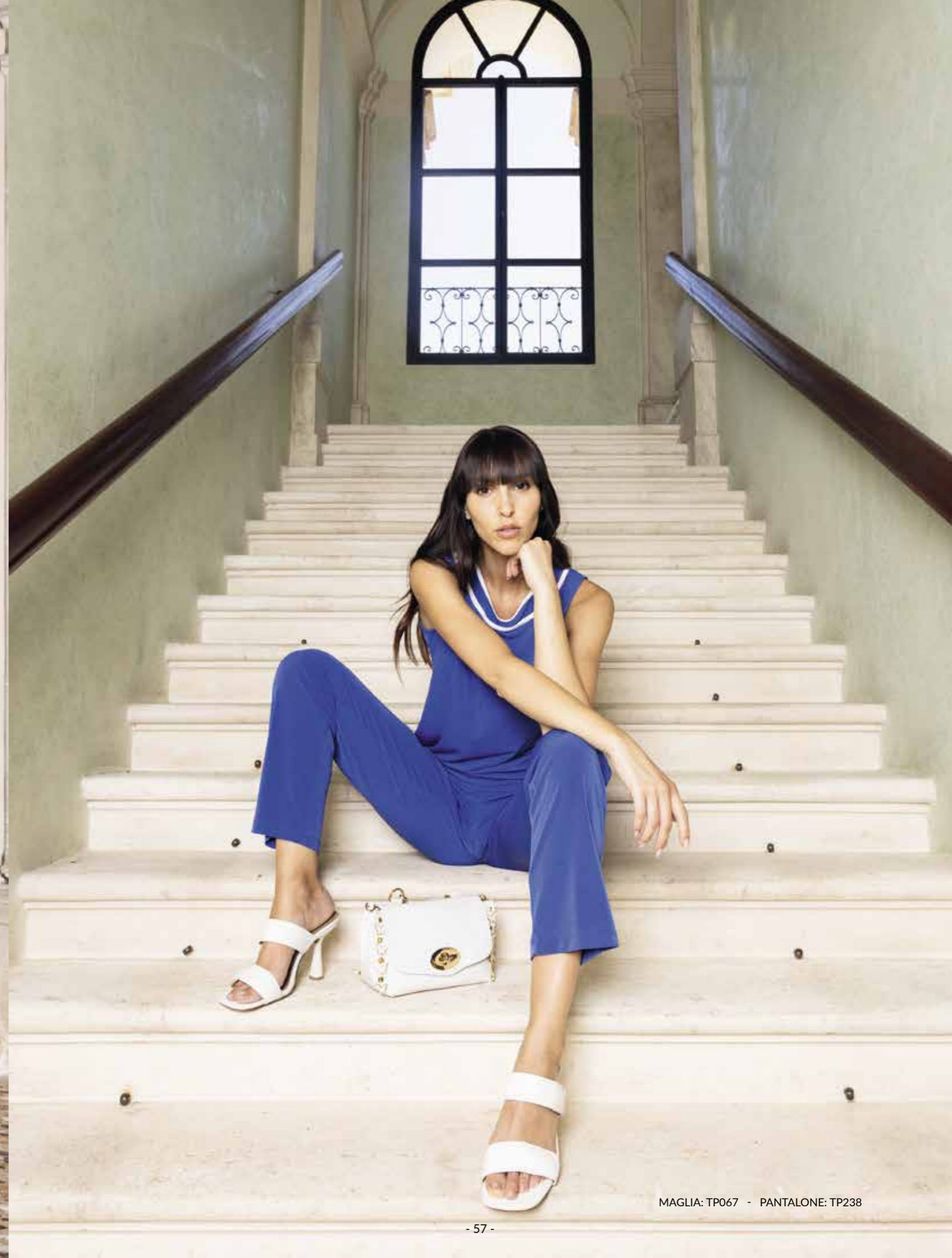
MAGLIA: TP067 - PANTALONE: TP238