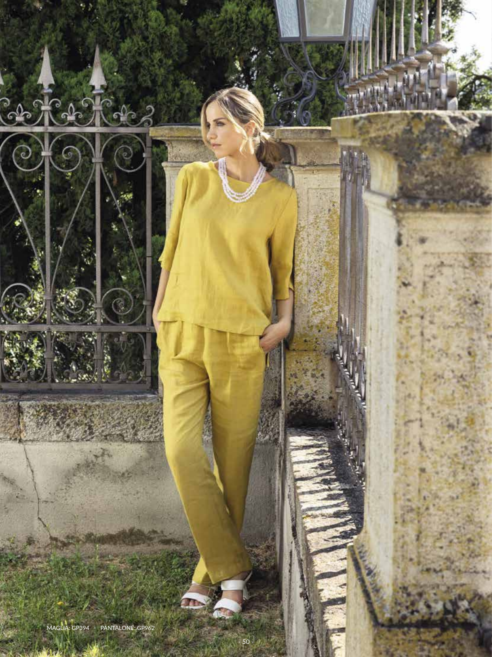
MAGLIA: GP394 - PANTALONE: GP962