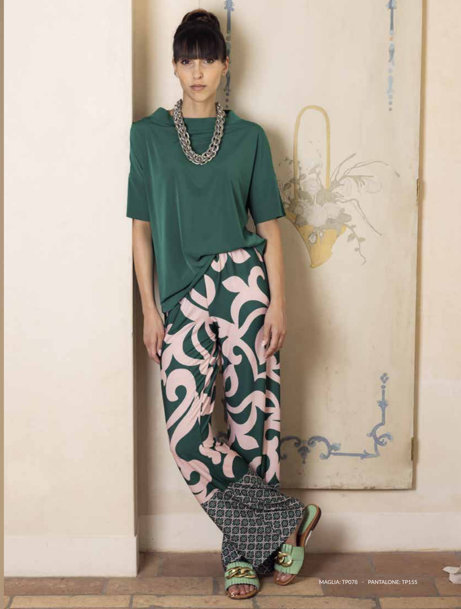
MAGLIA: TP078 - PANTALONE: TP155