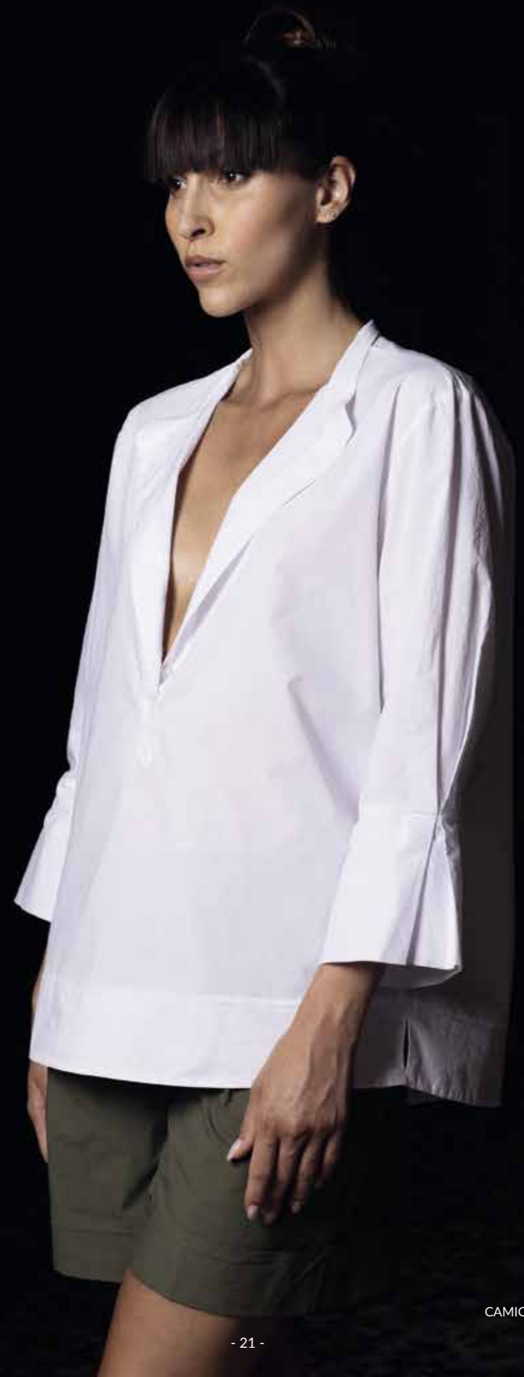
CAMICIA: PE157 - SHORT: PE155