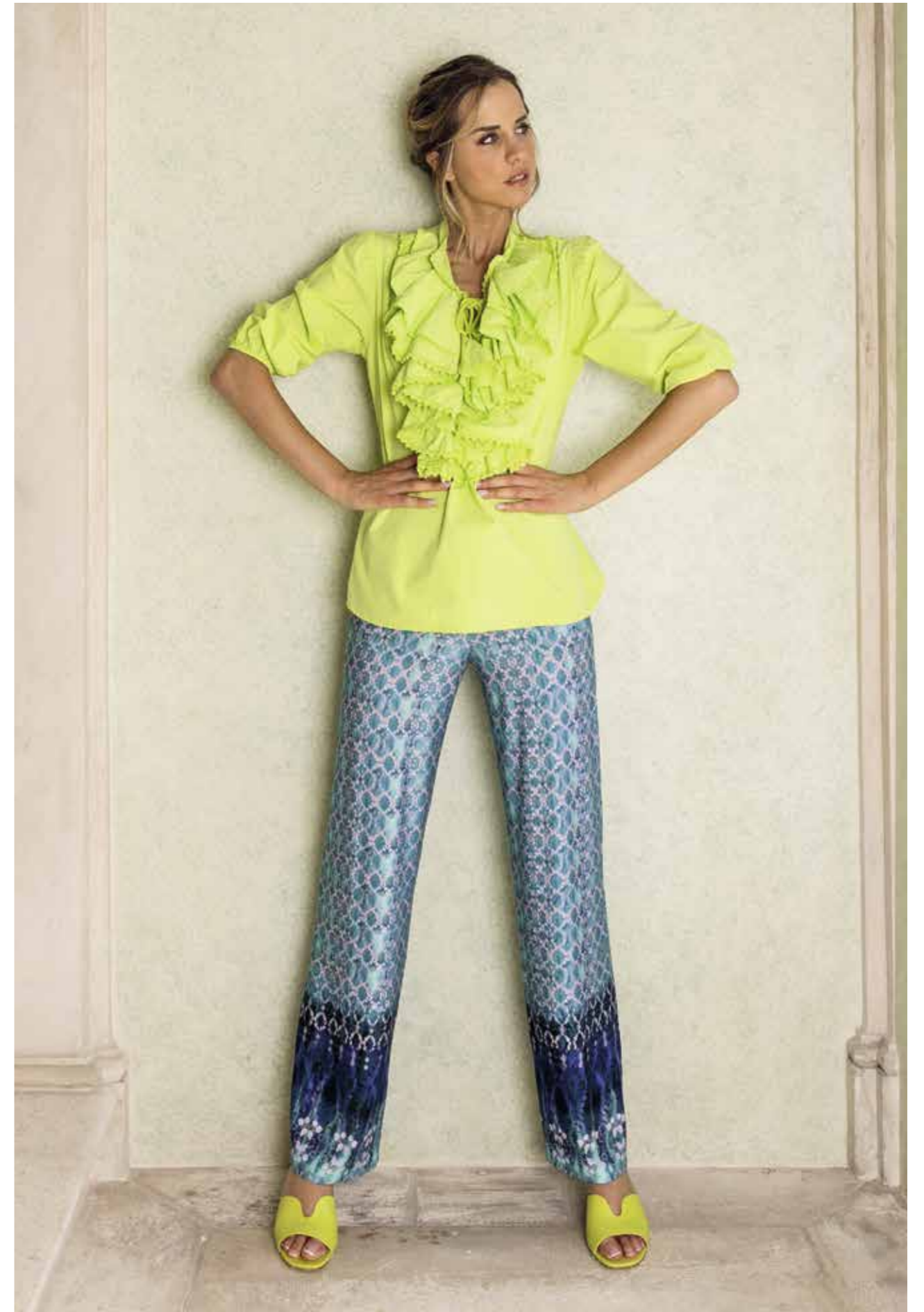
MAGLIA: PE160 - PANTALONE: EP812