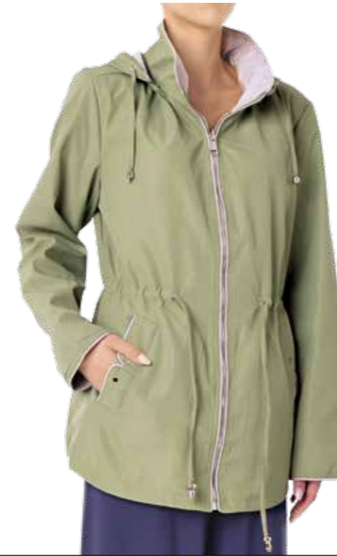
RE 830 (CAPO REVERSIBILE)