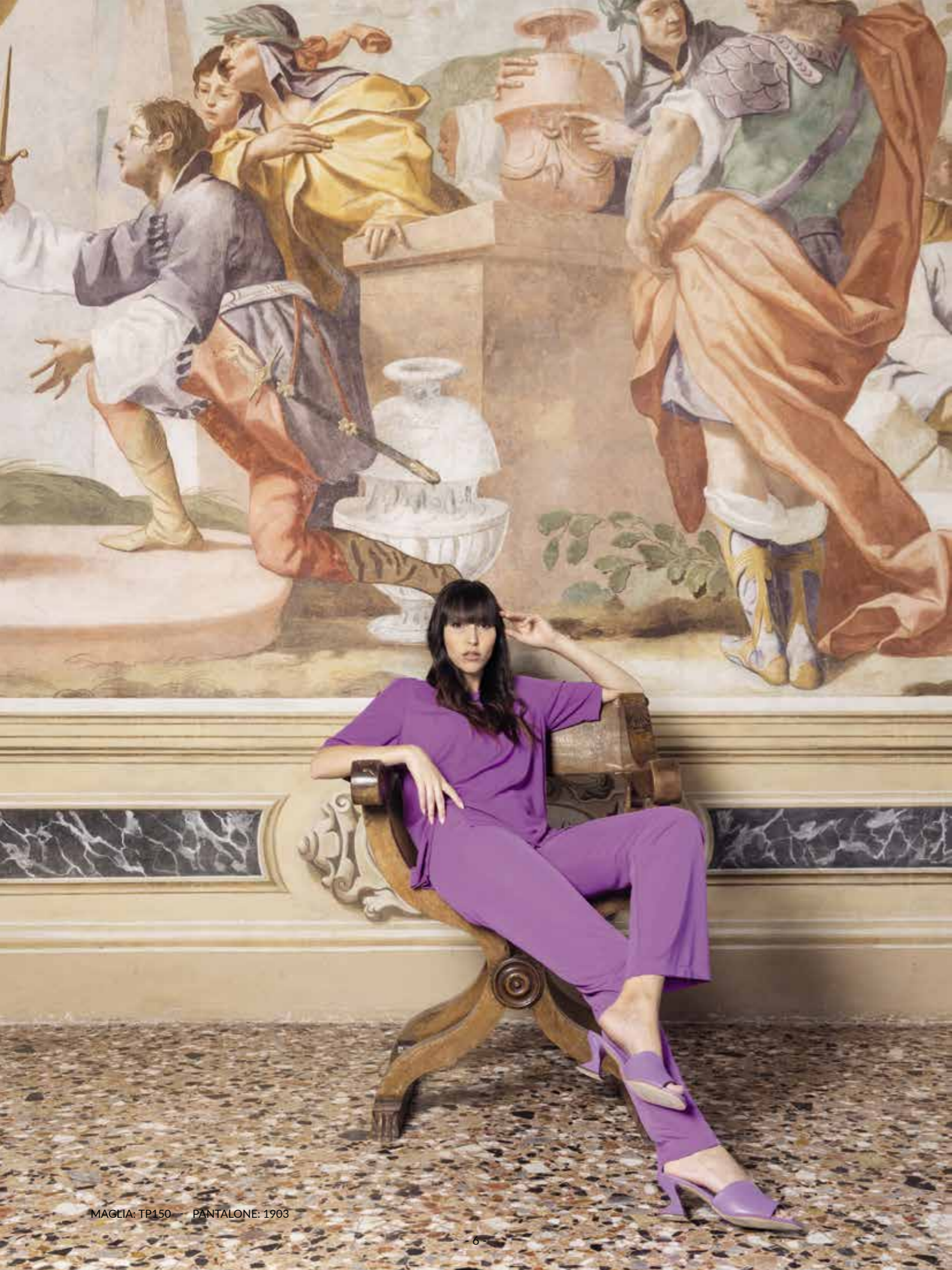
MAGLIA: TP150 - PANTALONE: 1903