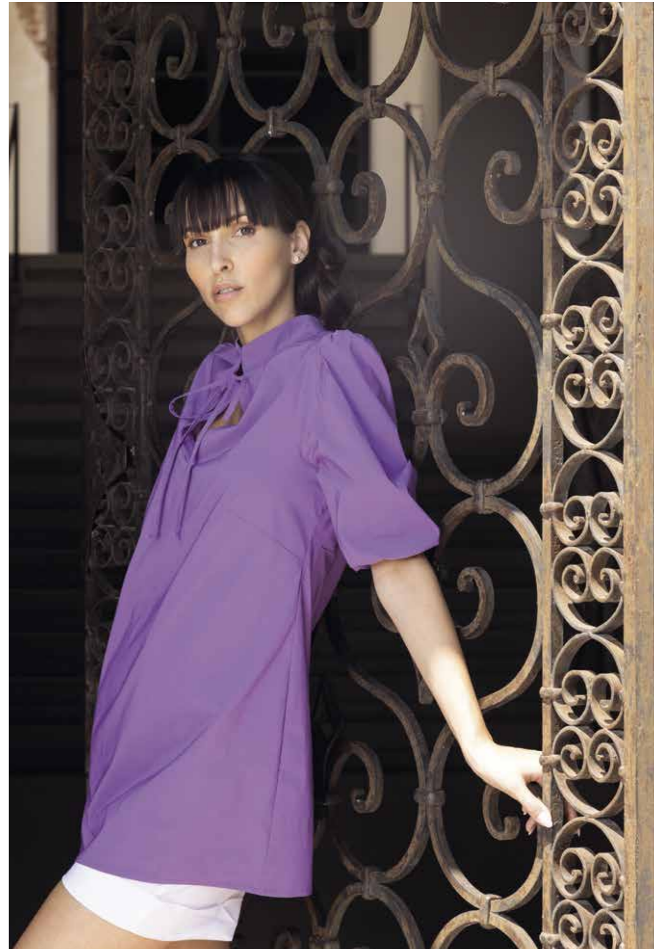
MAGLIA: FP255 - SHORT: FP193