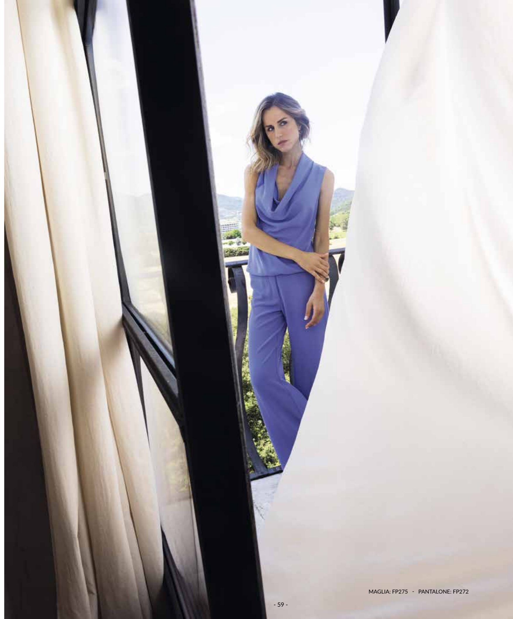
MAGLIA: FP275 - PANTALONE: FP272