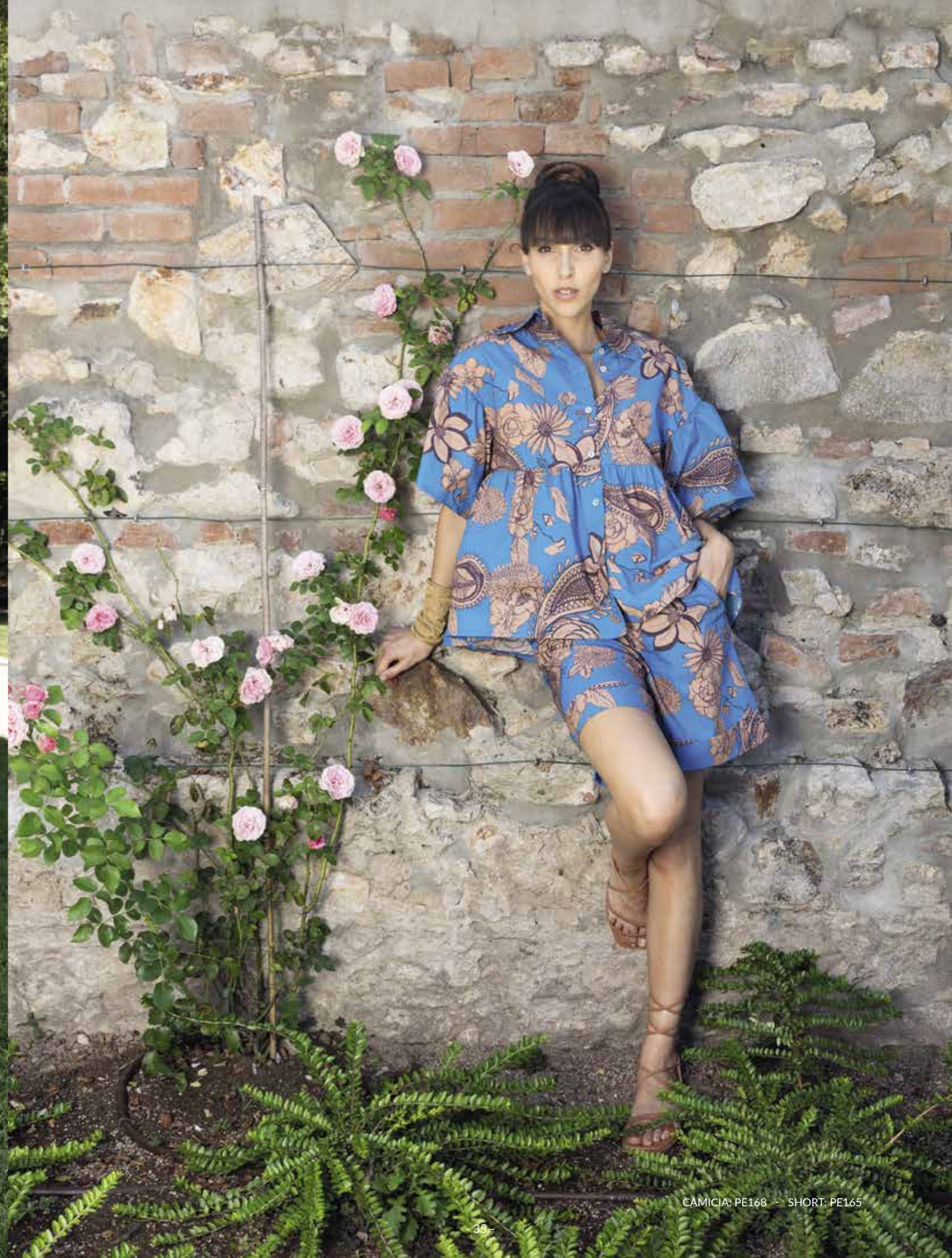
CAMICIA: PE168 - SHORT: PE165