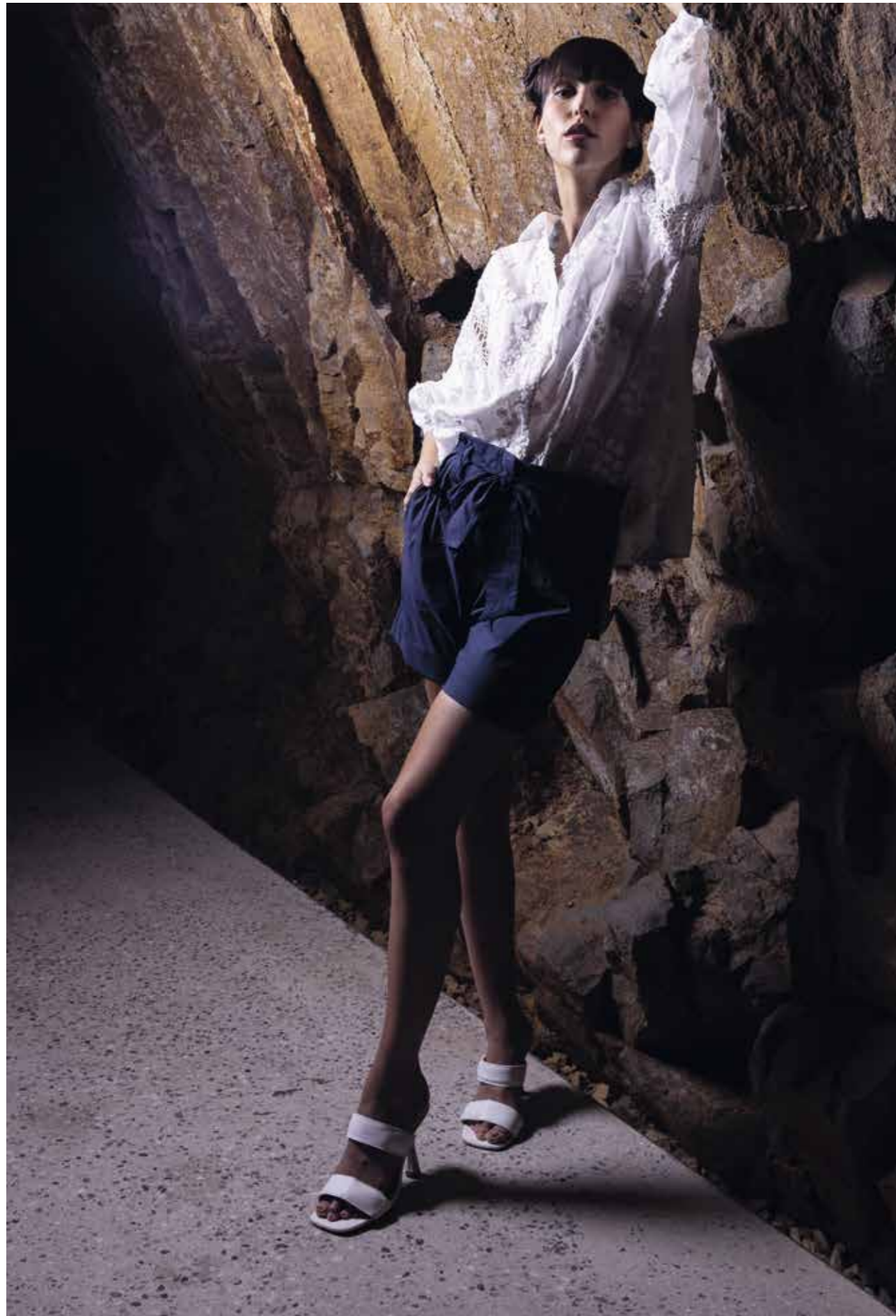
CAMICIA: PE187 - SHORT: FP193