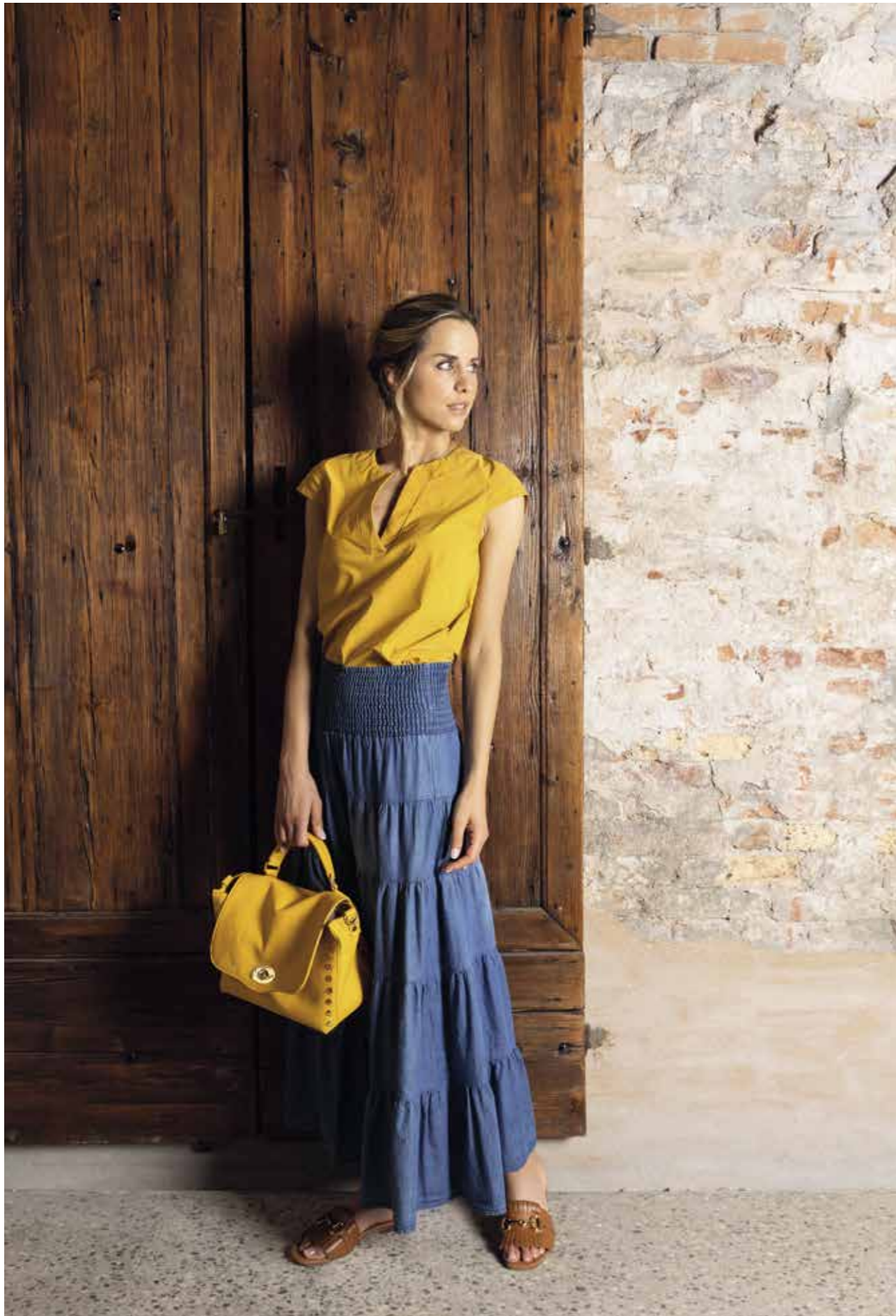
MAGLIA: FP258 - GONNA: PE184